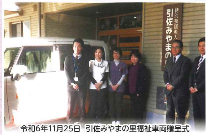
令和6年11月25日 引佐みやまの里福祉車両贈呈式