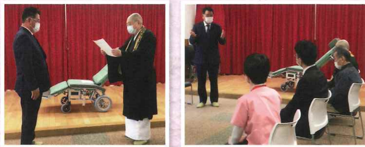
令和7年2月18日 引佐みやまの里車椅子贈呈式