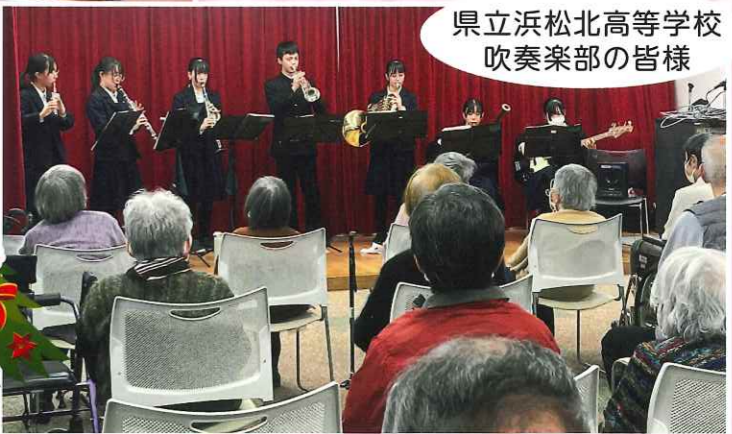
県立浜松北高等学校 吹奏楽部の皆様